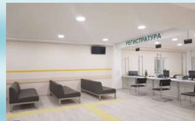
Реализован проект «вежливая регистратура» (2017г.)