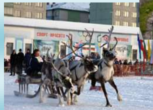
Ежегодный праздник Севера «Гонки на оленьих упряжках»