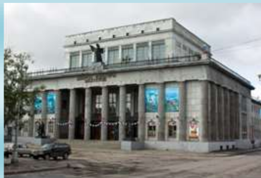
Государственный театр кукол