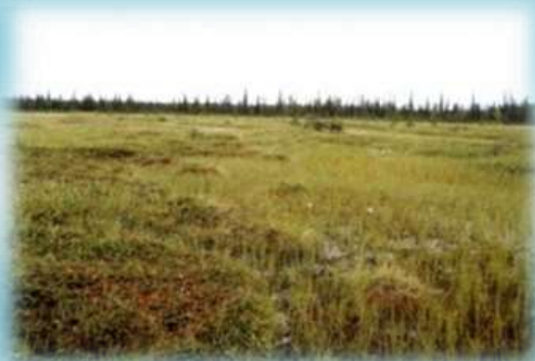
Болотный памятник природы «У фермы Юнь-Яга»