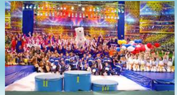
Ежегодная Спартакиада народов Севера «Заполярье»