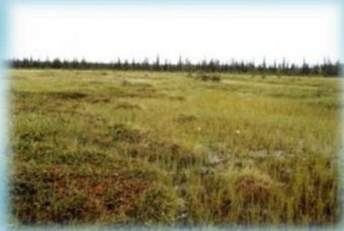
Болотный памятник природы «У фермы Юнь-Яга»