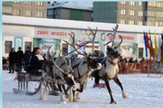
Ежегодный праздник Севера «Гонки на оленьих упряжках»