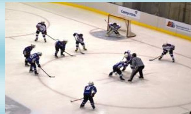
3 катка, 46 спортзалов