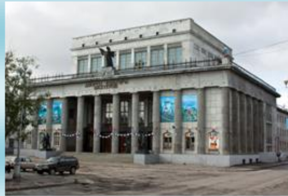
Государственный театр кукол