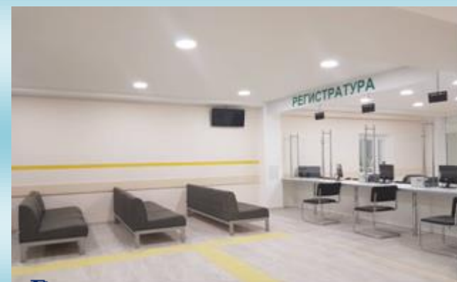
Реализован проект «вежливая регистратура» (2017г.)