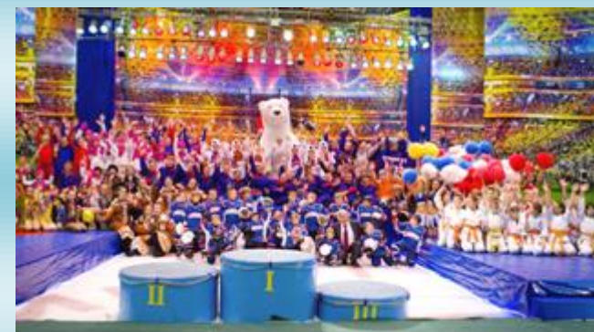
Ежегодная Спартакиада народов Севера «Заполярные игры»